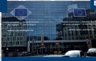
Ausschuss der Regionen Europäischer Wirtschafts- und Sozialausschuss