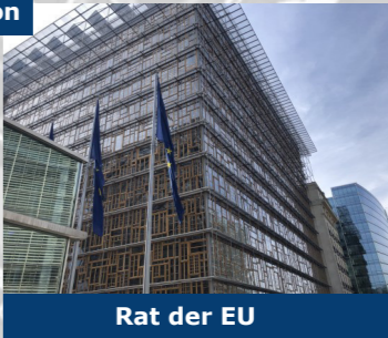
Rat der EU